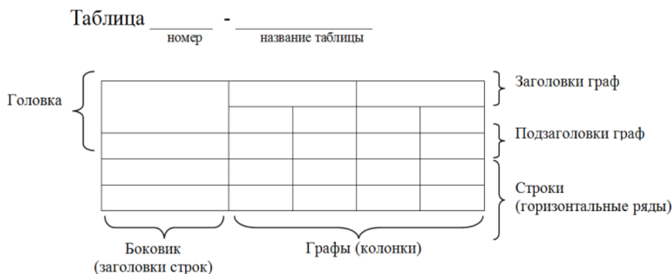
Рисунок 1 – Построение таблиц

7.20.4. Таблицу с большим количеством строк допускается переносить на другой лист (страницу). При переносе части таблицы название помещают только над первой частью таблицы, нижнюю горизонтальную черту, ограничивающую таблицу, не проводят. Над другими частями пишут слово «Продолжение» и указывают номер таблицы, например, «Продолжение таблицы 1».